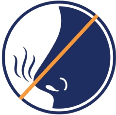
pérdida reciente del olfato o el gusto