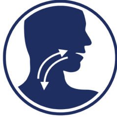
falta de aire o dificultad para respirar