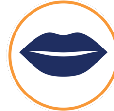
labios o cara azulados