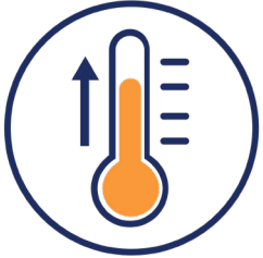
fiebre o escalofríos