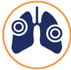
dificultad para respirar grave