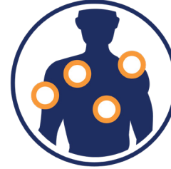
dolores musculares y corporales