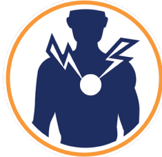
dolor o presión persistente en el pecho